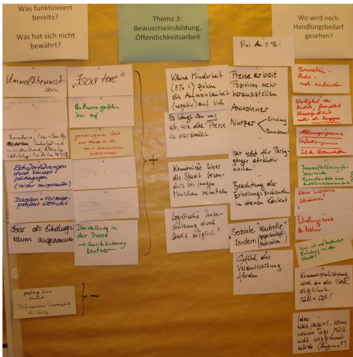
Abb. 8 Kartenmitschrift