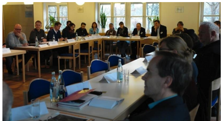
Abb. 1 Plenum