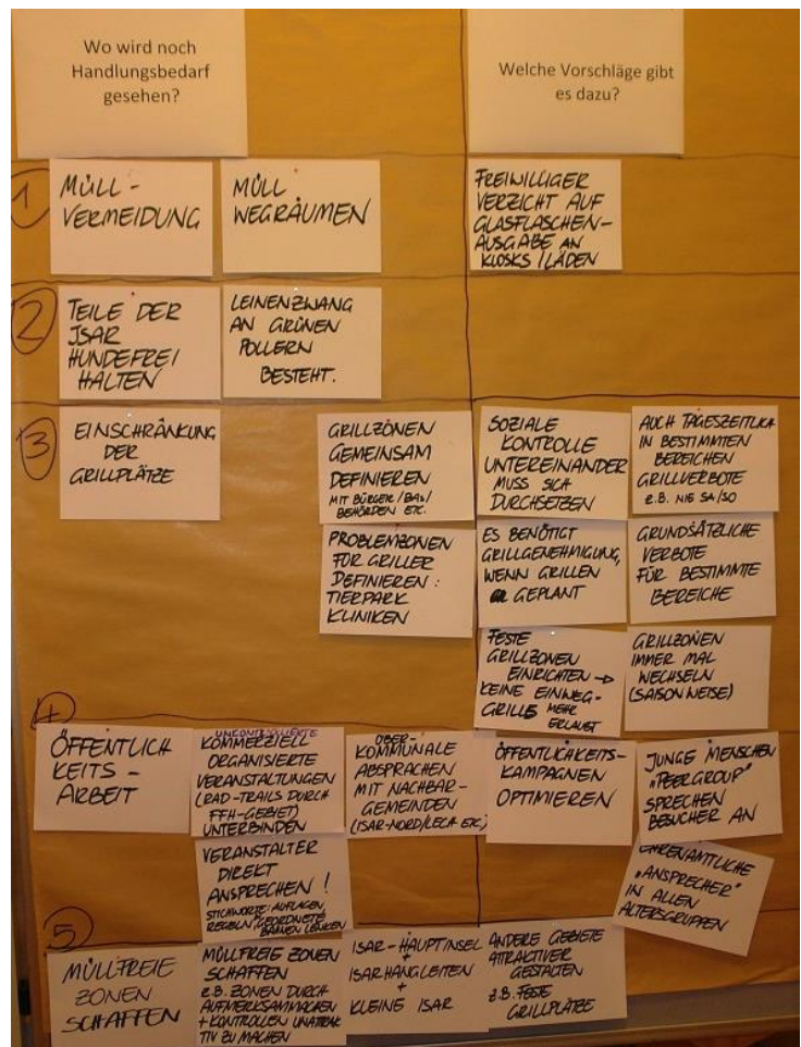
Abb. 5 Kartenmitschrift