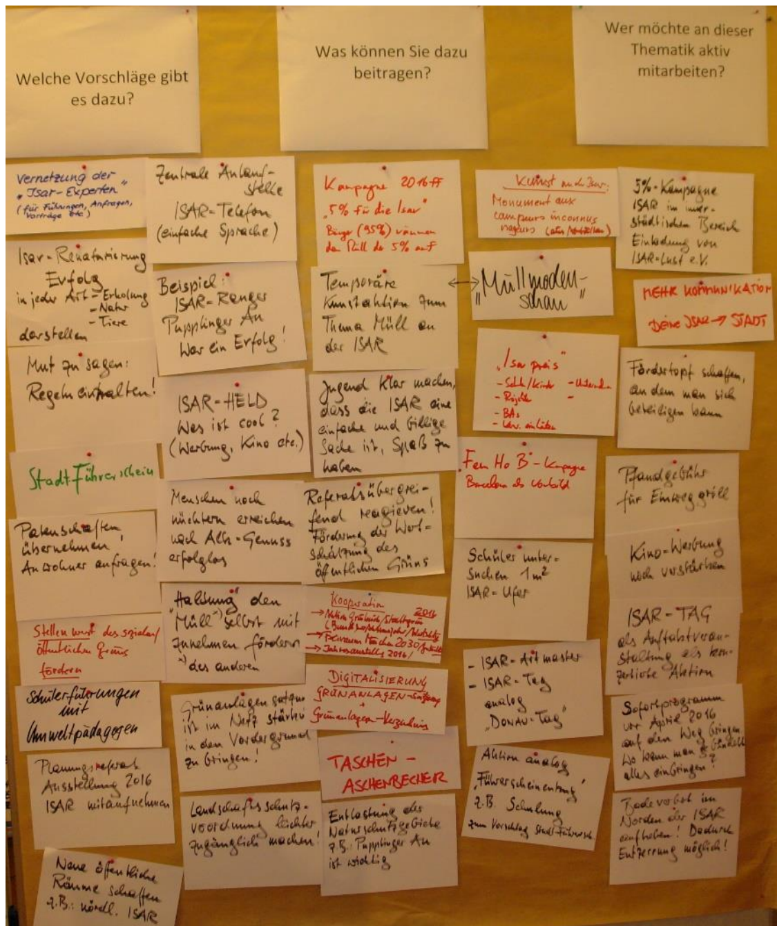
Abb. 9 Kartenmitschrift