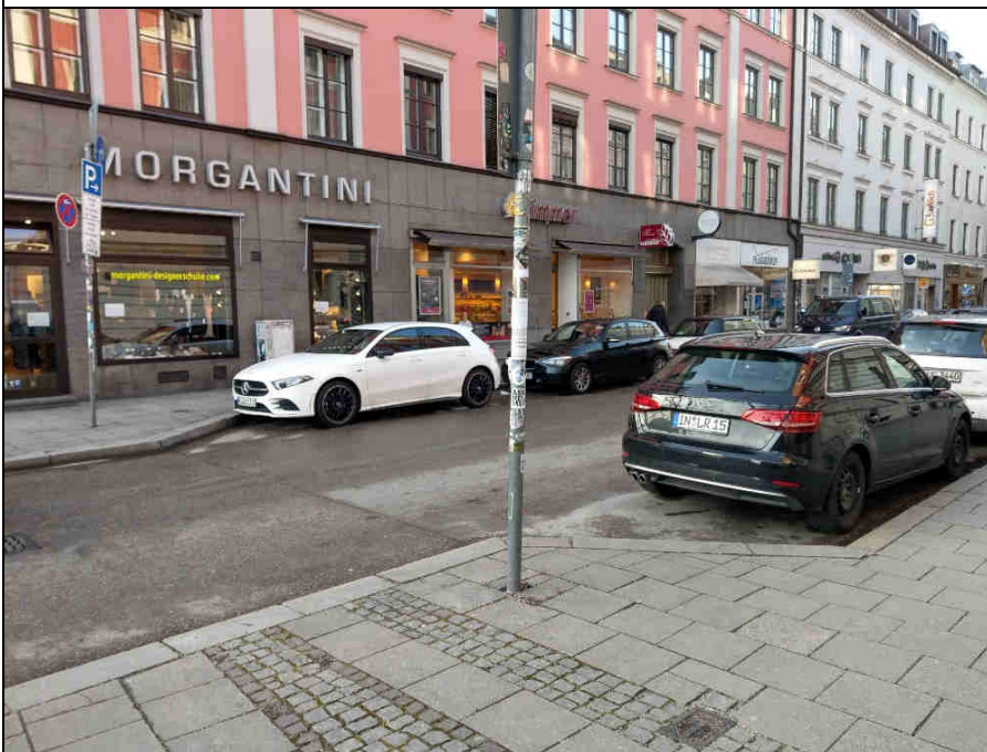
Standort 10 Gärtnerplatz/ Reichenbachstr.