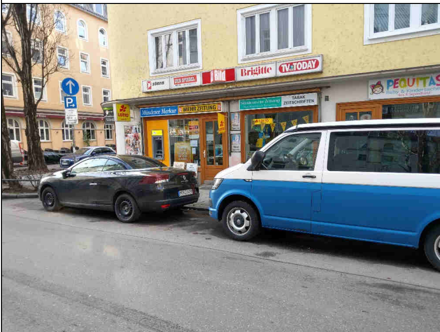
Standort 5 Baaderplatz