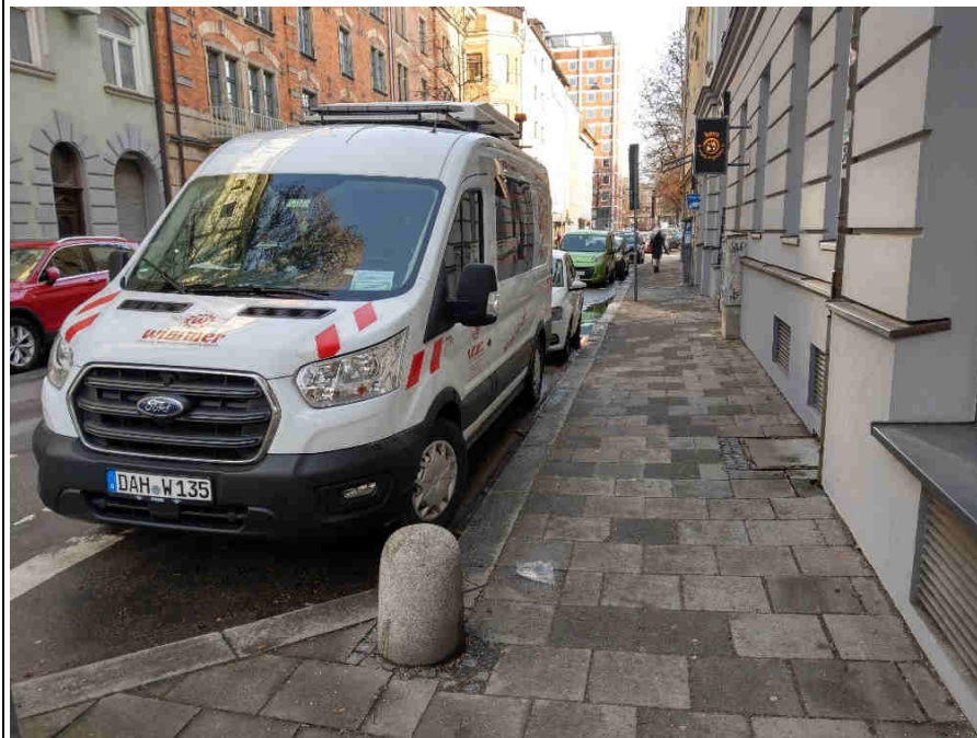
Standort 6 Kohlstr./ Baaderstr.