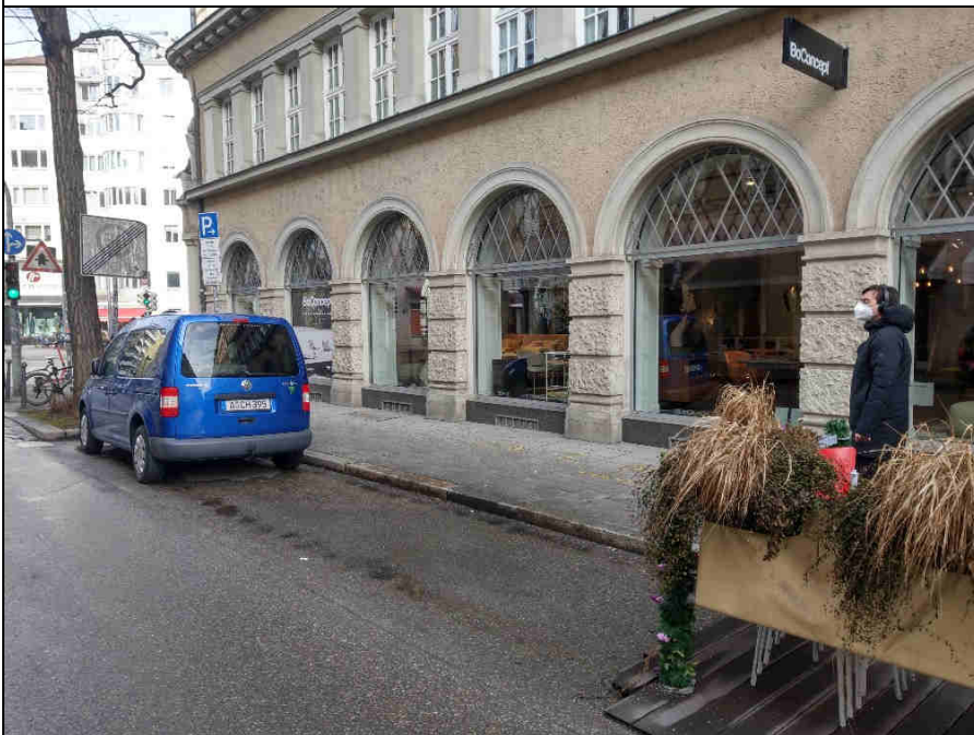
Standort 1 Reichenbachstr.