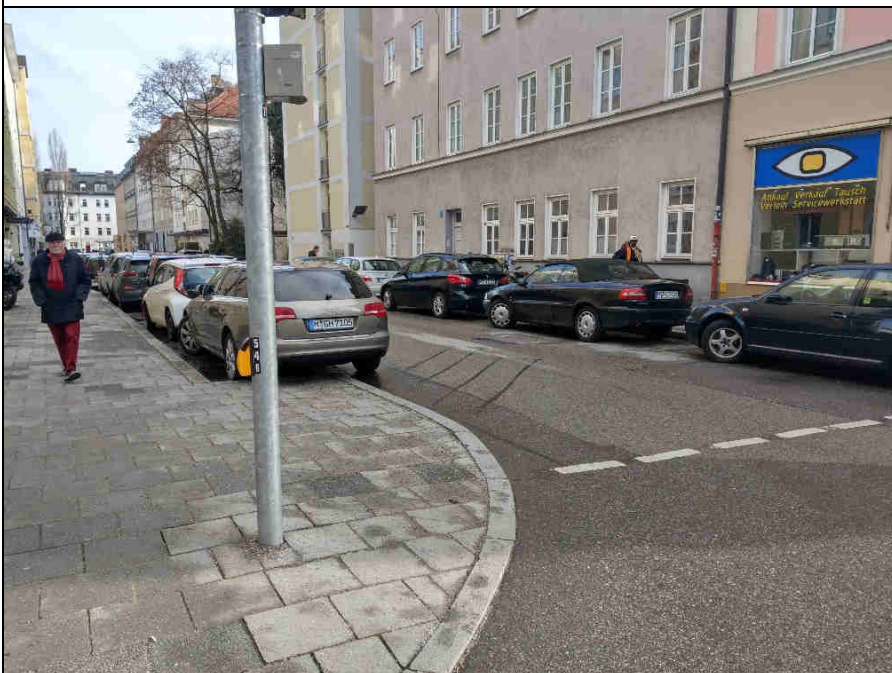
Standort 2 Buttermelcherstr.