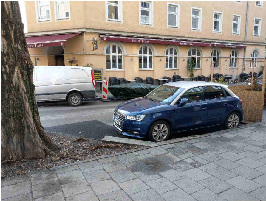
Standort 5 Baaderplatz, Buttermelcherstr.