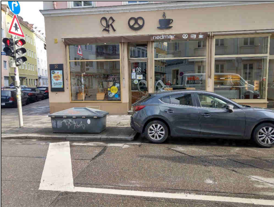
Standort 2 Klenzestr.