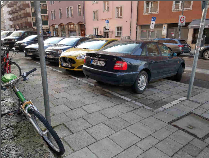
Standort 7 Morassistr./ Zweibrückenstr.