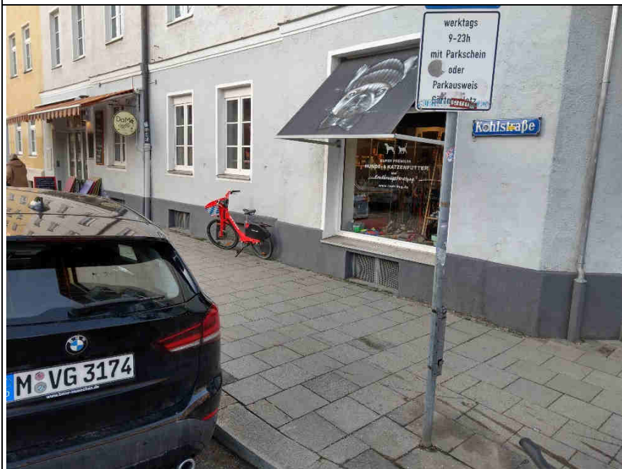
Standort 8 Morassistr./ Kohlstr.