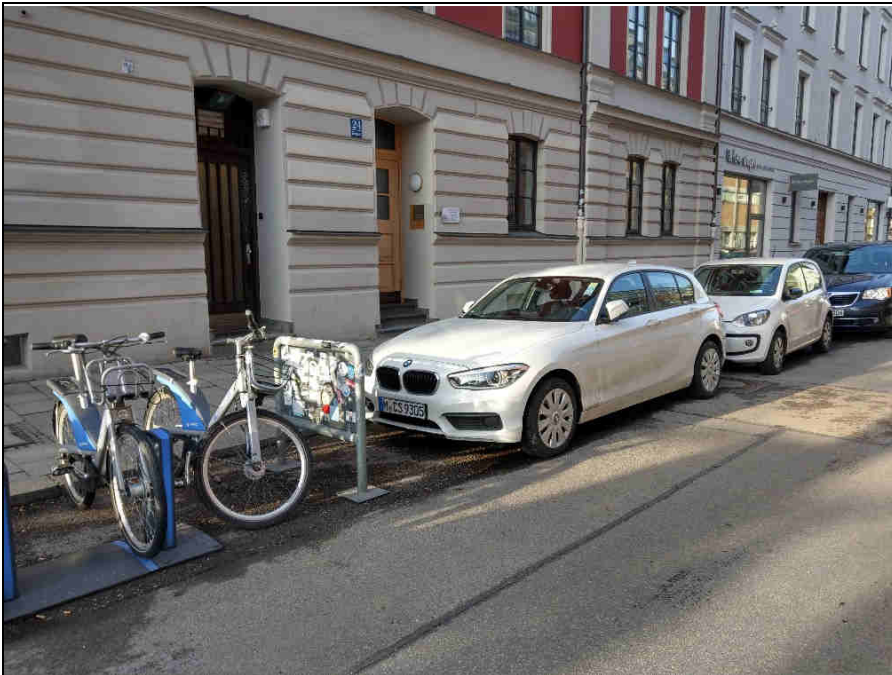
Standort 9 Gärtnerplatz/ Klenzestr.