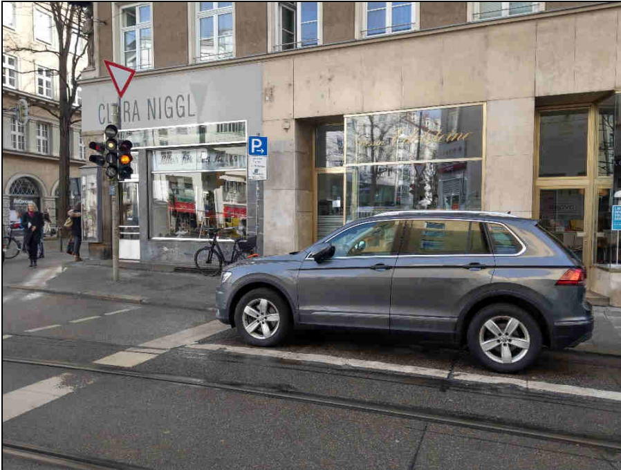
Standort 1 Rumfordstr.

Fotos zur aktuellen Situation an den Standorten: