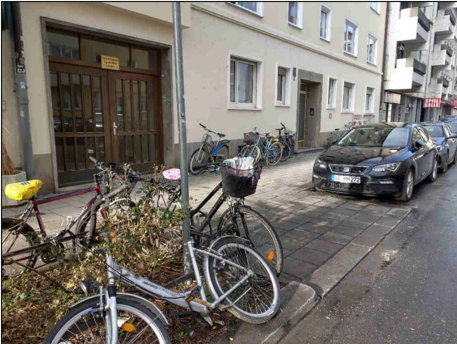
Standort 2 Klenzestr. 12