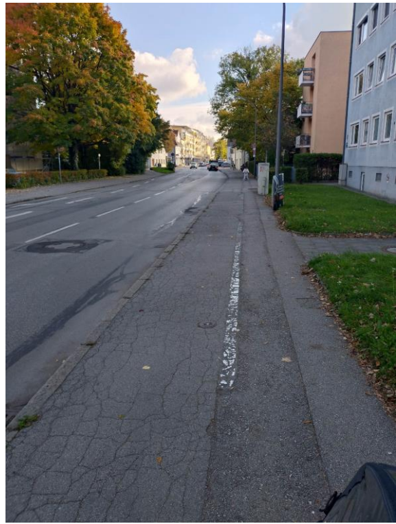
Abbildungen 4 & 5: Reste alter Markierungen auf dem Gehweg, Feldmochinger Str., stadteinwärts, von Kreuzung Feldmochinger Str. / Bingener Str. bis Feldmochinger Str. 41