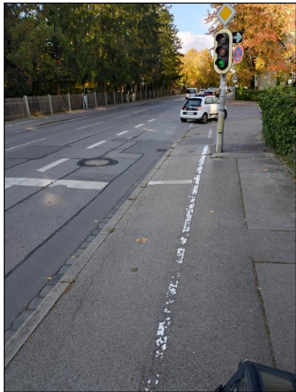
Abbildungen 2 & 3: Reste alter Markierungen auf dem Gehweg, Feldmochinger Str., stadtauswärts, Höhe Hausnummern 40-42