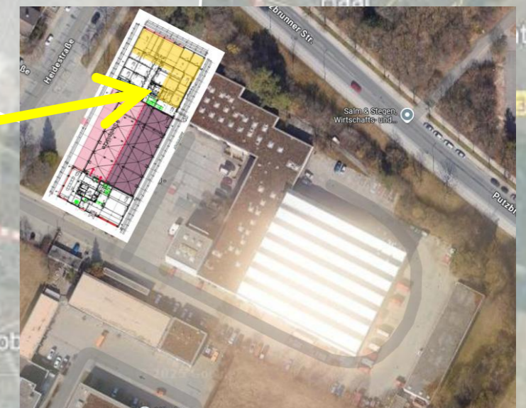
FW 9 Sanierung