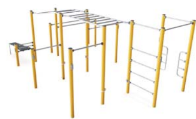
Calisthenics - Visualisierung