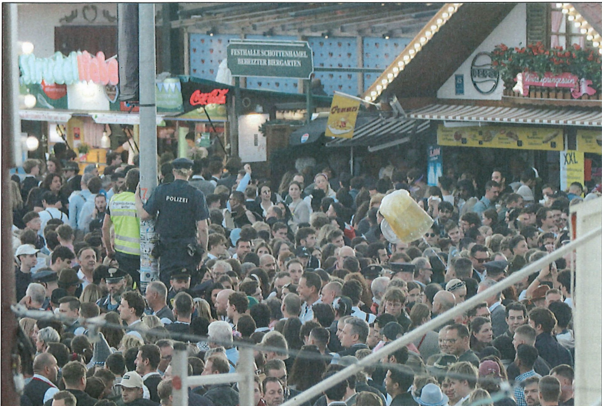
Abbildung 2: Überfüllung der Wirtsbudenstraße am 27.09.2025