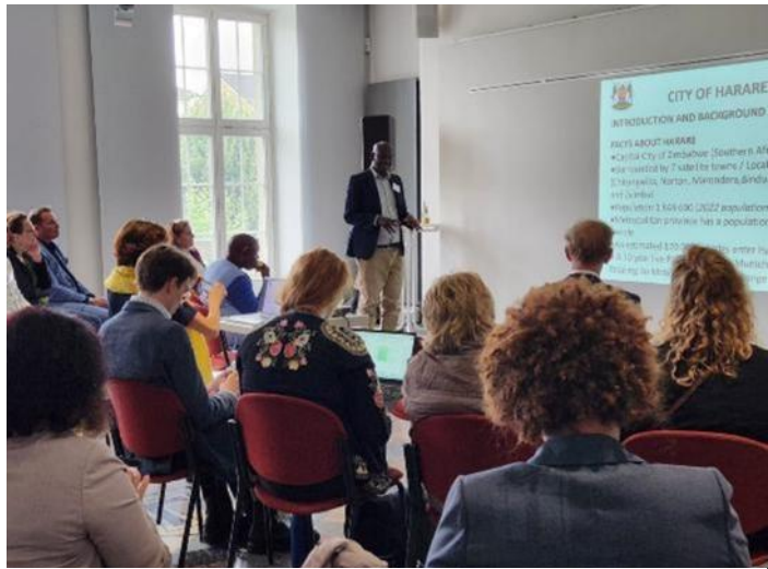
Abbildung 23: Konferenz Gießen