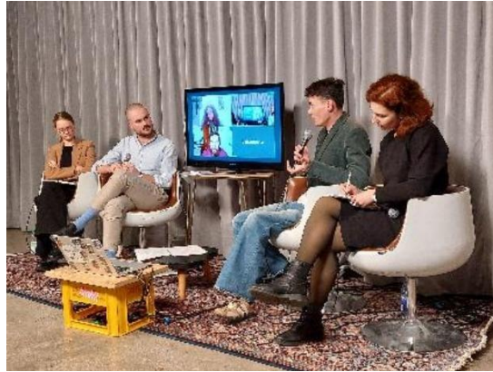
Abbildung 25: Solidarität mit Kyiv, ©LHM

Solidarität nach drei Jahren Krieg: Lebensrealitäten und Perspektiven in Kyiv und der Ukraine (Veranstaltung, FF RBS)