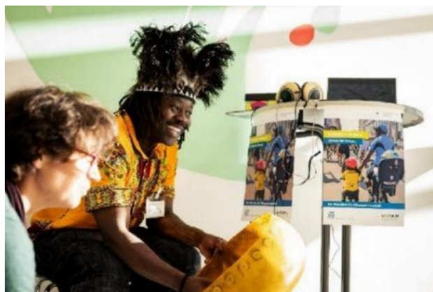
Abbildung 21:Entwicklungspolitische Messe Harare

Messe „München global solidarisch aktiv“ im Kulturzentrum LUISE: Sichtbarkeit für Partnerschaftsgruppen.