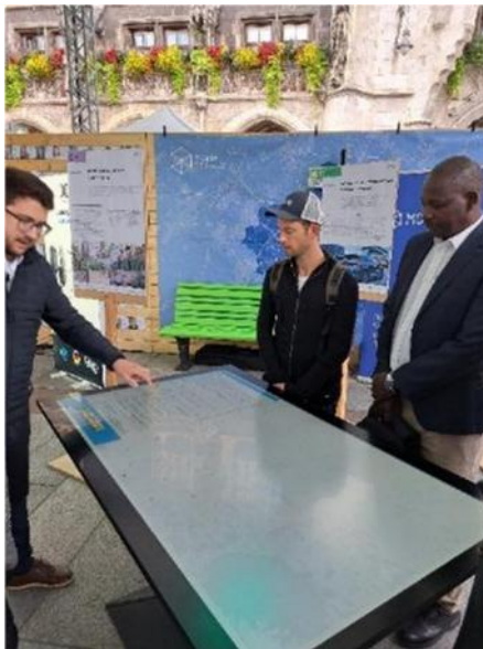
Abbildung 22: Besuch IAA

Betreuung des anschließenden Delegationsbesuchs in München, mit Besuch der IAA, Fachsitzungen und einem Stehempfang auf politischer Ebene im Rathaus am 12.09.2025.