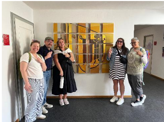
Abbildung 15: Lehrkräfte aus Cincinnati in München