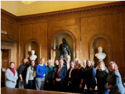
Abbildung 16: Gruppenfoto mit Lord Provost und Generalkonsulin, ©Sylvia Kling

Dialog- und Hospitationsprogramm in Edinburgh mit 12 Münchner Lehrkräften