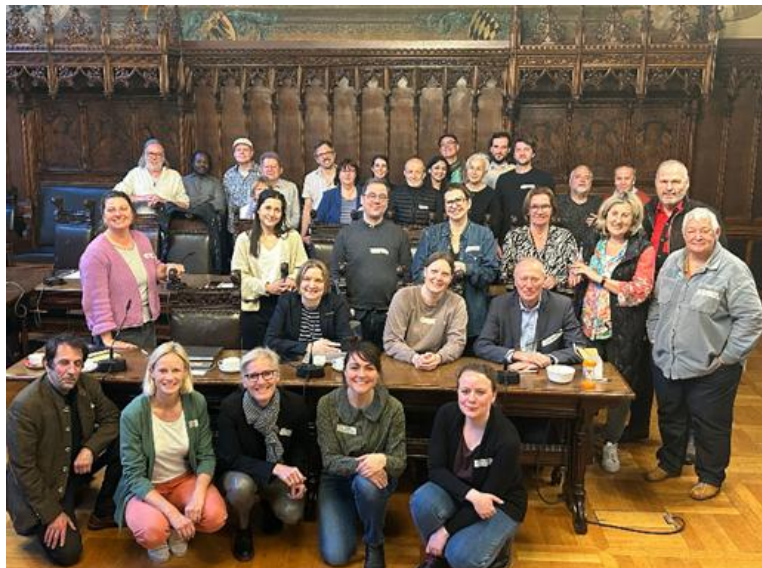
Abbildung 20: Runder Tisch Harare, ©RAW

Runder Tisch Harare im Rathaus, Kleiner Sitzungssaal und Harare Stammtisch (organisiert mit HaMuPa): Austausch mit jeweils circa 30 engagierten Vertreter*innen der Zivilgesellschaft.