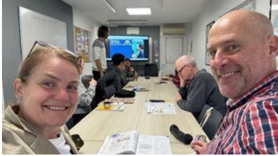
Abbildung 8: Hospitation in der Sprachschule Alliance Française

Zwei Lehrkräfte der städtischen Berufsoberschule Anita Augspurg nahmen an einem Job Shadowing an der Alliance Française in Bordeaux zum Aufbau einer Kooperation teil.