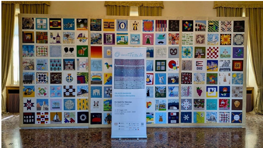
Abbildung 36: Quilt in Verona, ©Andrea Deller

Zum 65-jährigen Jubiläum der Partnerschaft zwischen München und Verona hat unser „Quilt für München“, der sonst im Alten Rathaus hängt, den Weg in unsere italienische Partnerstadt gefunden. Im Rahmen der renommierten Textilausstellung „Verona Tessile“ wurde der Quilt im Palazzo Barbieri präsentiert. Er symbolisiert die Verbundenheit Münchens mit seinen Partnerstädten: Edinburgh, Bordeaux, Verona, Sapporo, Cincinnati, Kyiv, Harare und Be'er Sheva.