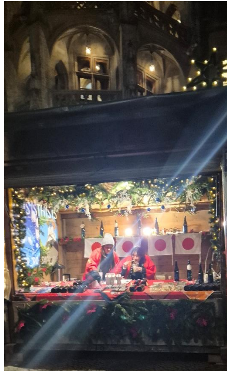
Abbildung 35: Verkaufsstand Sapporo

Die Partnerstadt Sapporo hat einen Verkaufstand mit regionalen Produkten auf dem Münchner Christkindlmarkt (Prunkhof).