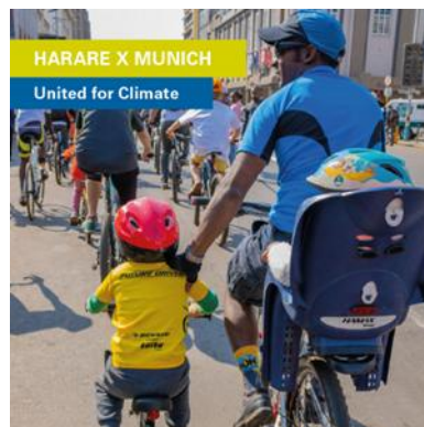
Abbildung 19: Klimaschutz und aktive Mobilität

Produktion und Veröffentlichung des Films „Harare x Munich: United for Climate“.