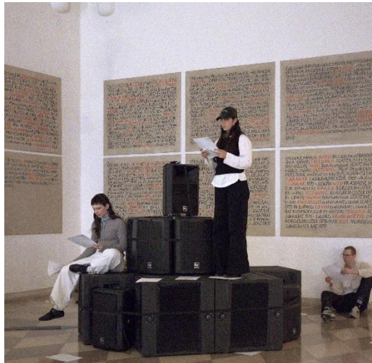
Abbildung 37: Migration erinnern