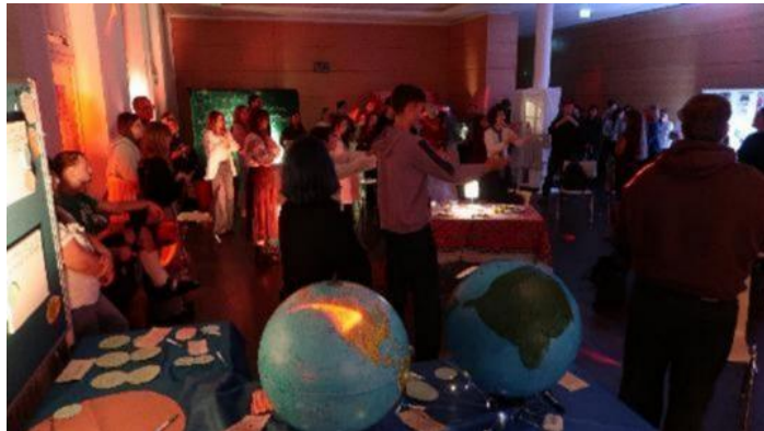
Abbildung 28: GenEU Home

Projekt/Veranstaltung „Home“ – Jugendliche aus München und Kyiv teilen ihre persönlichen Geschichten über Sich-Zuhause-Fühlen. Das Projekt „Home“ ist im Rahmen des internationalen Jugendprogramms- und Netzwerks „Generation Europe – The Academy“ entstanden. 20 Jugendliche aus sechs verschiedenen Herkunftsländern, die in München und der Ukraine (Großteil aus Kyiv) leben.