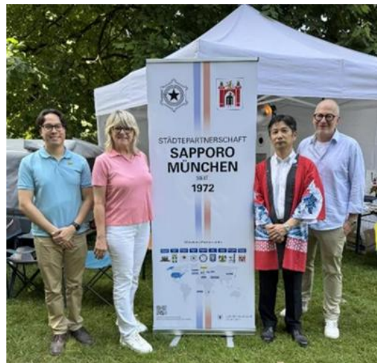
Abbildung 33: Vor dem Städtepartnerschafts-stand