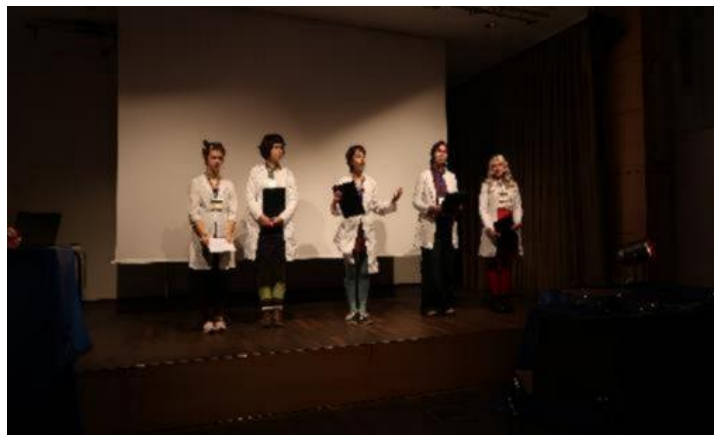
Abbildung 29: GenEU Home