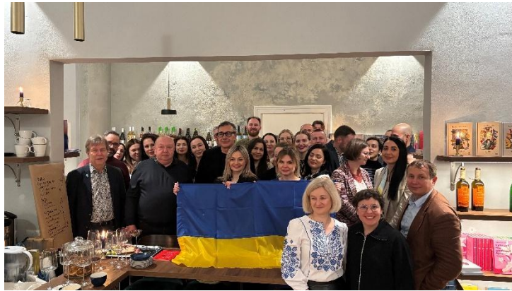
Abbildung 30: SUN4Ukraine in München

Zwei Vertreter*innen der Stadt Kyiv besuchten München im Rahmen des EU-geförderten Projekts SUN4Ukraine (insgesamt waren 24 Vertreter*innen aus zwölf ukrainischen Kommunen in München)