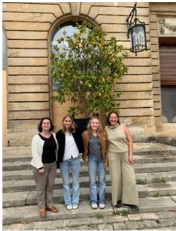
Abbildung 7: Empfang in Bordeaux, RBS

Zwei Schüler*innen und eine Lehrkraft des staatlichen Erasmus-Grasser-Gymnasiums in Bordeaux waren, um ein Praktikum zu absolvieren.