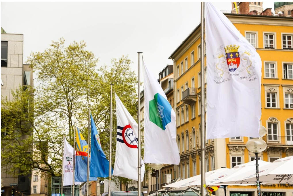
Abbildung 40: Auf die Freundschaft!

Anlässlich des Welttags der Partnerstädte am 27. April hisst die Landeshauptstadt München die Flaggen ihrer acht Partnerstädte – Edinburgh, Verona, Bordeaux, Sapporo, Cincinnati, Kyiv, Harare und Be'er Sheva – auf dem Marienplatz. Der Welttag der Partnerstädte – der jährlich am letzten Sonntag im April gefeiert wird – wurde 1963 vom Weltbund der Partnerstädte ins Leben gerufen, um Werte wie Frieden, Demokratie, Rechtsstaatlichkeit und internationale Zusammenarbeit zwischen Städten und Gemeinden zu fördern. Eine Städtepartnerschaft hat das Ziel, kulturelle und wirtschaftliche Austauschmöglichkeiten zu schaffen und Menschen über nationale Grenzen hinweg zusammenzubringen. Sie sind ein wichtiges Instrument zur Stärkung der Völkerverständigung. München pflegt Städtepartnerschaften mit insgesamt acht Städten auf vier verschiedenen Kontinenten, die sich in Art und Intensität unterscheiden. Mit der ältesten Partnerstadt Edinburgh feierte die Stadt im Jahr 2024 das 70-jährige und mit Bordeaux das 60-jährige Jubiläum.