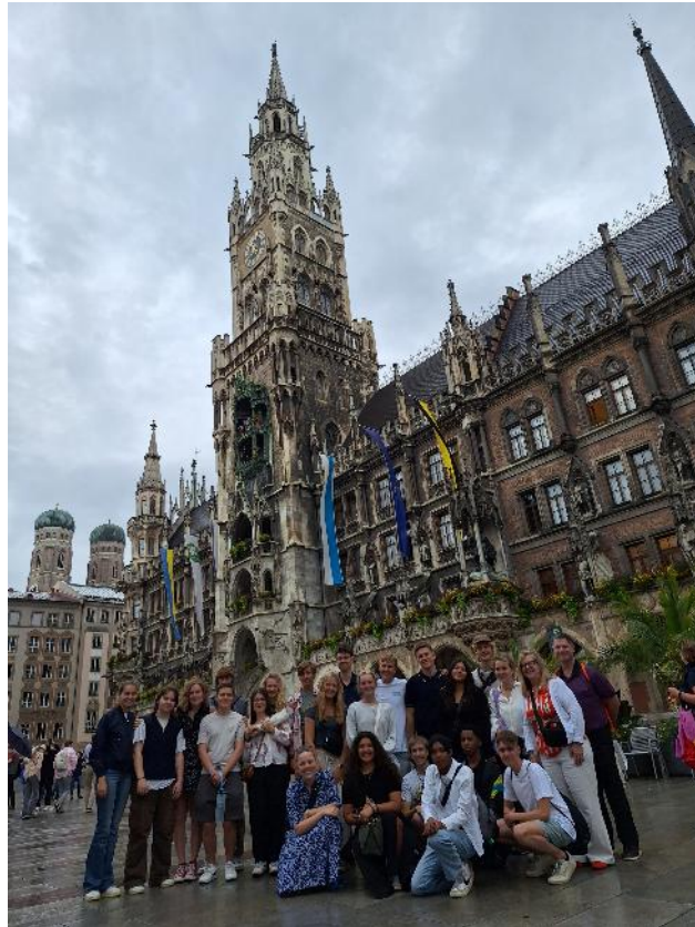
Abbildung 12: Austausch Schüler*innen

Austauschprogramm auf Gegenseitigkeit mit Cincinnati April - 12 Münchner Schüler*innen und zwei ehrenamtliche Teamerinnen in Cincinnati Juli 2025 – Cincinnati Schüler*innen in München