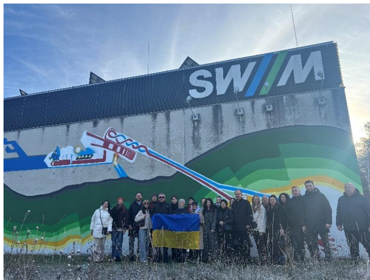
Abbildung 31: SUN4Ukraine in München