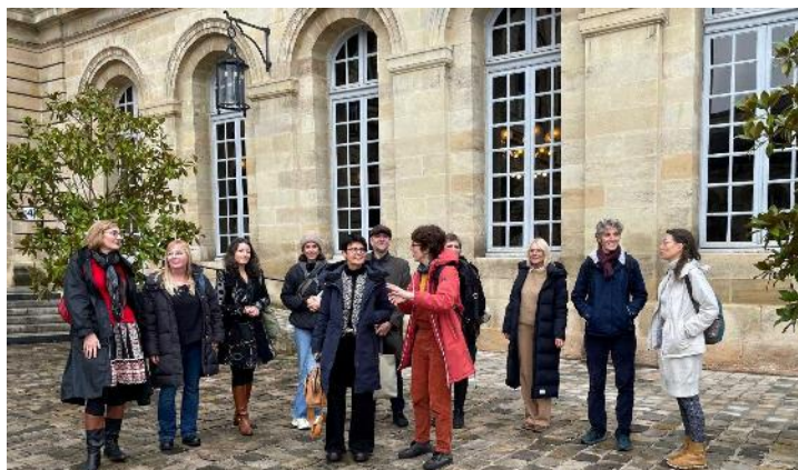
Abbildung 11: Bordeaux Rathaus, ©RBS

09. – 15.12.2025 und 23.02. – 02.03.2026