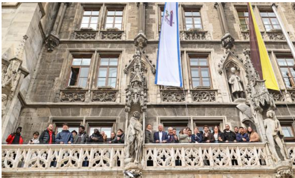
Abbildung 1: Zusammen mit OB Dieter Reiter besuchten die Fußballfans aus Be'er Sheva und München den Meisterbalkon des Rathauses, ©Nagy

Stehempfang des Oberbürgermeisters für die Jugendfanclubs von Hapoel Be'er Sheva und FC Bayern München im Kleinen Sitzungssaal mit hochrangigen Gästen aus der Politik und dem Sport. Präsentation der Jugendlichen aus Be'er Sheva über den Austausch und das Programm in München. Der Höhepunkt des Empfangs war das Foto auf dem Meisterbalkon des Rathauses.