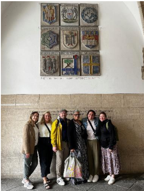
Abbildung 14: Lehrkräfte aus Cincinnati mit Städtepartnerwappen, ©Sylvia Kling

Fünf Lehrkräfte aus München und fünf Lehrkräfte aus Cincinnati nehmen am Austauschprogramm auf Gegenseitigkeit teil.