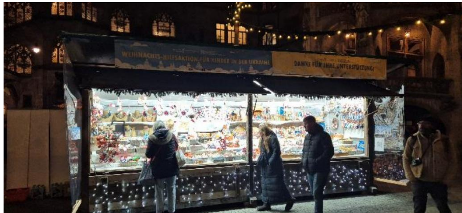
Abbildung 26: Verkaufstand Kyiv

Die Partnerstadt Kyiv hat einen Verkaufstand auf dem Münchner Christkindlmarkt im Innenhof des Rathauses.