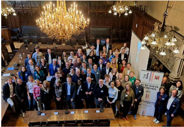
Abbildung 2: 1. Runder Tisch Be'er Sheva

1. Runder Tisch Be'er Sheva mit anschließendem Empfang.