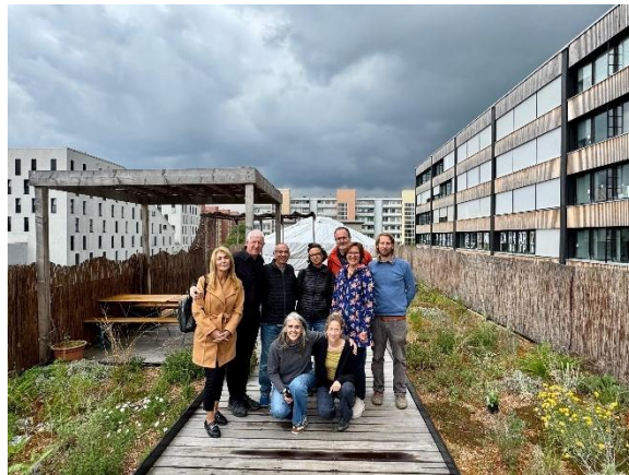
Abbildung 3: NEBourhoods NPL Delegationsbesuch Be'er Sheva

22.05.2025 Besuch des NEBourhoods Schattenpavillon am Campus di Monaco der Montessori Schule in Neuperlach.