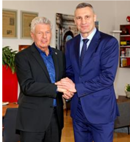
Abbildung 24: OB Dieter Reiter mit Vitali Klitschko im Rathaus

Treffen des Oberbürgermeisters Dieter Reiter mit dem Bürgermeister unserer Partnerstadt Kyiv - Vitali Klitschko