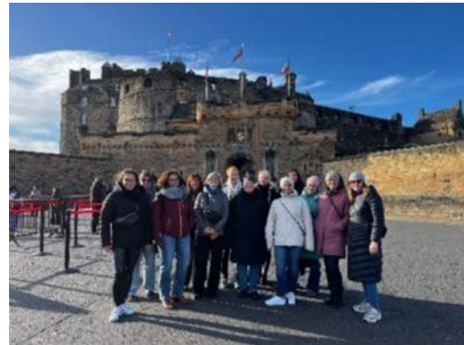
Abbildung 17: Gruppenfoto Edinburgh Castle