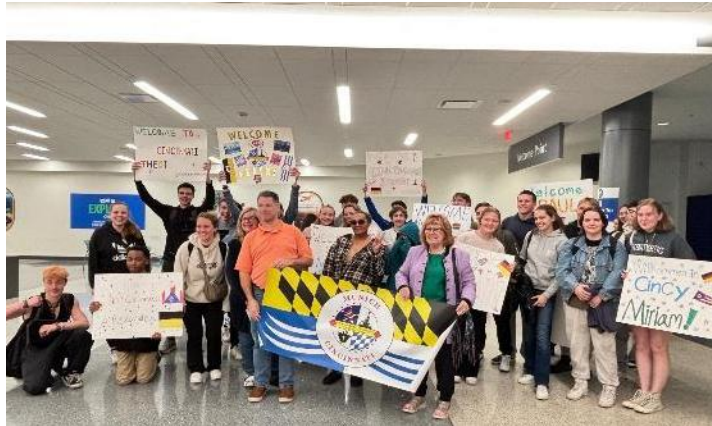
Abbildung 13: Welcome to Cincinnati, ©Veronica Paul

13. – 26.04.2025 und 26.05. – 07.06.2025