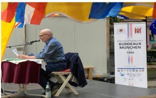
Abbildung 4: Gerhard Bökel - freier Autor und ehemaliger hessischer Innenminister