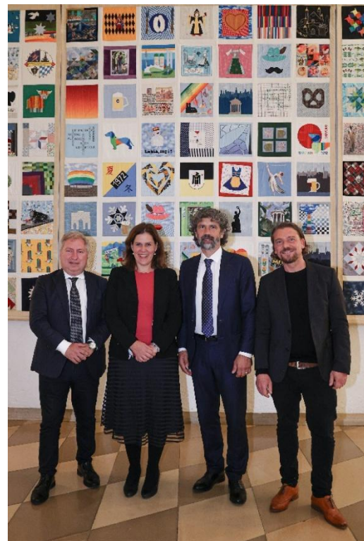
Abbildung 39: Auftaktveranstaltung Migration erinnern und 65 Jahre Städtepartnerschaft zwischen Verona und München