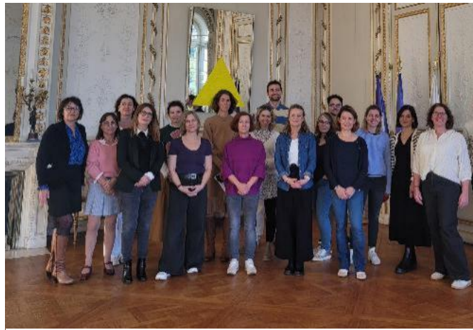
Abbildung 10: Sprachkurs an der Alliance Française in Bordeaux

12 Lehrkräfte von Münchner Schulen nahmen an einem einwöchigen Sprachkurs, gefördert durch Erasmus+, an der Sprachschule Alliance Française in Bordeaux teil.