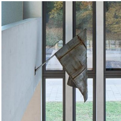
Abbildung 27: ©NS Doku, Connolly Weber

Nikita Kadan als Teil der Ausstellung „... damit das Geräusch des Krieges nachlässt, sein Gedröhn“ im NS-Dokuzentrum