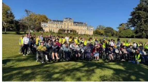
Abbildung 9: Besuch eines Altenheims in Merignac